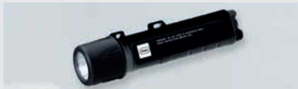
ART. 243788 LED-HANDLEUCHE/HELMLEUCHE 6141/62