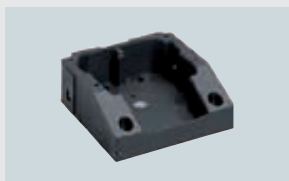
ART. 212701 ADAPTER FÜR EISEMANN-/CEAG-LADESTATION