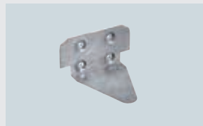
ART. 212332 WANDHALTER