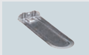
ART. 212331 GÜRTELHAKEN