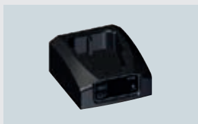
ART. 225781 LADESELSEL

Für unseren Handscheinwerfer der Serie 6148 bieten wir eine große Auswahl an Zubehör und Ersatzteilen – passend für Ihren Bedarf.