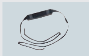
ART. 212702 SCHULTERGURT