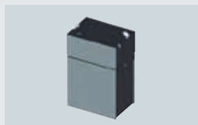
ART. 211124 AKKU 6148 ART. 225707 AKKU L148