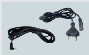
ART. 120014 LADEKABEL 230 V ART. 212316 LADEKABEL 12/24 V