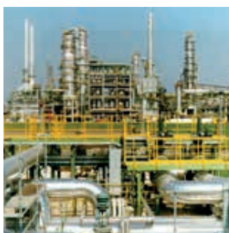
Petrochemie und Chemische Industrie