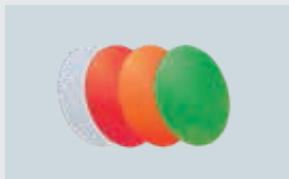
STREUSCHEIBEN ART. 212333 KLAR, ART. 212956 ROT ART. 212334 ORANGE, ART. 220306 GRÜN