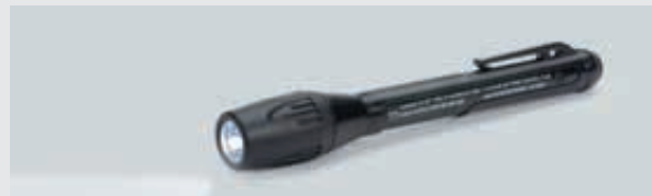
ART. 203478 LED-HANDLEUCHE 6141/61

Weiteres Zubehör für die Handleuchten der Reihe 6141 finden Sie auf r-stahl.com .