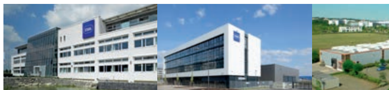
Deutschland – Waldenburg