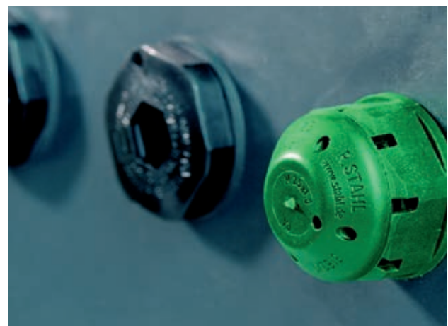
Bild 1: Der Druckausgleichstutzen schützt vor Eindringen von Feuchtigkeit