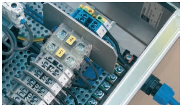
Bild 3: Trennplatte zur Trennung von eigensicheren und nicht eigensicheren Stromkreisen

Es ist sicherzustellen, dass es während oder nach Abschluss der Montage beim Verschließen der Geräte zu keiner Beschädigung der Leiterisolation kommen kann. So muss beispielsweise bei großen druckfest gekapselten Steuerungen mit herausklappbaren Montageebenen darauf geachtet werden, dass es beim Einklappen dieser Montageplatten oder beim Schließen der Druckraumdeckel keine mechanische Beschädigung von Kabeln und Leitern geben kann (Bild 2). Kabel- und Leitungseinführungen in erhöhter Sicherheit bieten zwar einen geprüften Zugentlastungsschutz, sind aber trotzdem lediglich für eine ortsfeste Verlegung geeignet, d. h., die Anschlussleitung muss außerhalb des Gehäuses separat mechanisch fixiert sein.