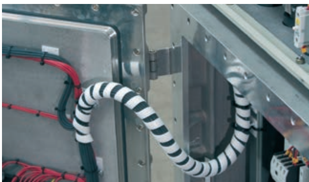
Bild 2: Kabel und Leiter sind vor mechanischer Beschädigung geschützt

Für Anlagen in explosionsgefährdeten Bereichen ist ein Potentialausgleich erforderlich. Bei TN-, TT- und IT-Systemen müssen alle Körper elektrischer Geräte und fremde leitfähige Teile an das Potentialausgleichssystem angeschlossen sein. Die Verbindungen müssen gegen Selbstlockern gesichert sein.